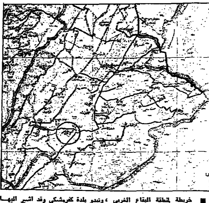
خريطة منطقة البقاع الغربي ، وتبين بلدة كرمشكي وقد اشرف اليها بدائرة